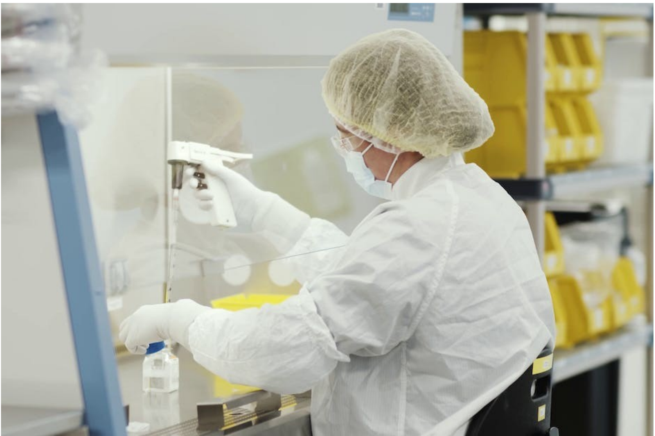
Eine Mitarbeiterin von Moderna bei der Herstellung eines Corona-Impfstoffs.

Aufgrund dessen führt die Injektion unmittelbar dazu, dass der Körper einen Schadstoff – und nicht wie bei herkömmlichen Impfungen unmittelbar einen spezifischen Abwehr- oder Schutzstoff (§ 4 Abs. 4 AMG) – selbst herstellt, siehe Arzneimittelgesetz (AMG) § 4 Abs. 4 . Die Bildung von Antikörpern und damit Schutzstoffen erfolgt erst im zweiten Schritt. Die Zulassung von Gentherapeutika als Impfung erfolgte auf einer von den allgemeinen Anforderungen an neue Arzneimittel (speziell Impfungen sowie insbesondere Gentherapeutika) abweichenden und entsprechend wissenschaftlich wie medizinrechtlich fragwürdigen Grundlage. Dieses führt zu unabsehbaren Folgen für die Gesundheit der Bevölkerung. Zwei wesentliche Aspekte werden nachfolgend dargestellt.