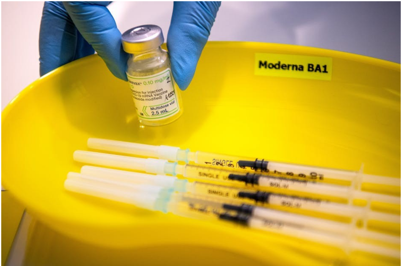
Spritzen mit Coronaimpfstoff

Damit hat die Kommission gegen rechtliche Vorschriften verstoßen, konkret gegen Art. 14-a Abs. 8 der Verordnung Nr. 726/2004/EG und Art. 7 der Kommissionsverordnung Nr. 507/2006/EG. Diese besagen: Eine bedingte Zulassung darf erst dann in eine reguläre Zulassung umgewandelt werden, wenn der Hersteller alle mit der bedingten Zulassung erteilten Auflagen erfüllt hat. So war ursprünglich Bedingung, Placebo-kontrollierte klinische Studien fortzuführen und deren Ergebnisse bis Ende 2023 beziehungsweise Mitte 2024 vorzulegen.