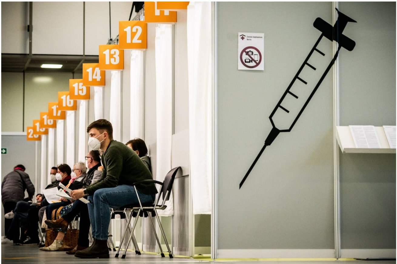
Impfen als Massenaktion: Corona-Impfzentrum auf dem Messegelände, April 2021