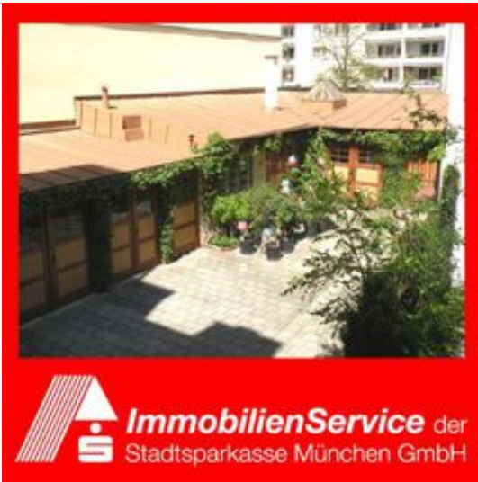
Innenhof mit Altbestand