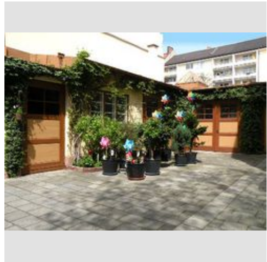
Werkräume und Garagen