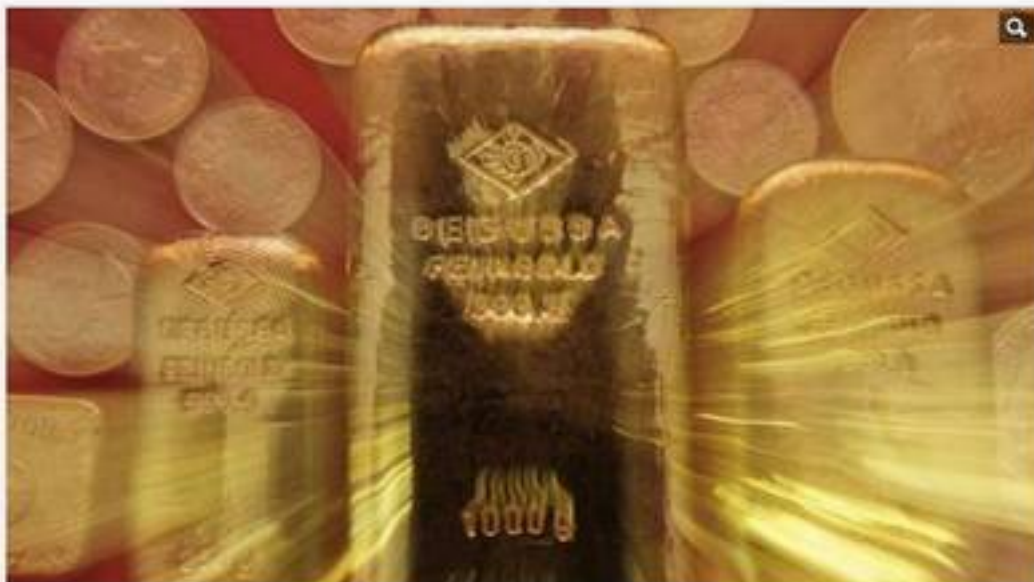
Anleger verkaufen ihre Gold-Reserven

Preise sinken + + + Experten sehen Trendumkehr voraus